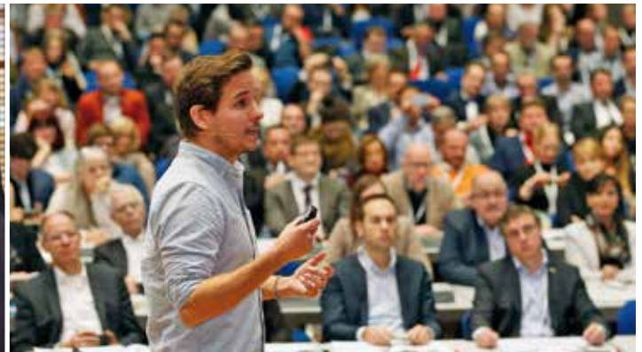
Best Practice – die besten Arbeitgeber Deutschlands im Interview