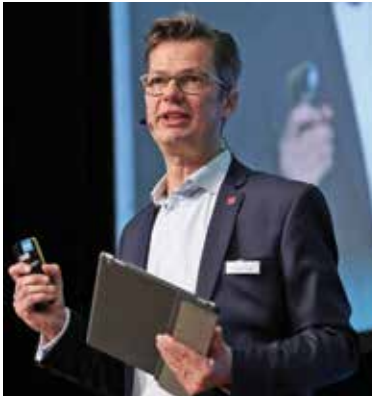
„Ted-Talks“ als Inspirationsquelle für Personalverantwortliche