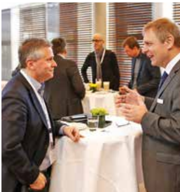
Austausch in der exklusiven VIP-Lounge