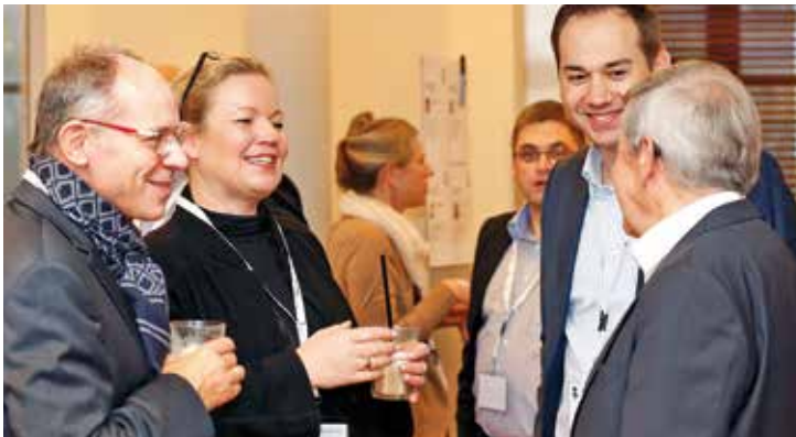
Treffpunkt für mittelständische Unternehmen