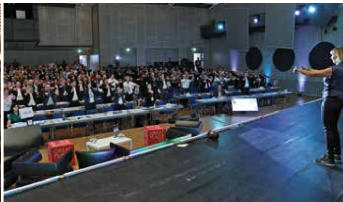
Engagierte Mittelständler sorgen für eine ausgebuchte Kongresshalle