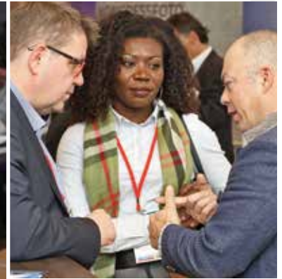
Erweitern Sie Ihr Netzwerk